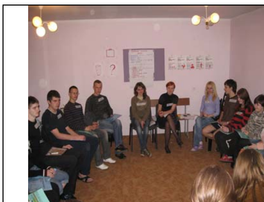
1.Тренинг 22 апреля 2010 в общ.№ 4 (ВиГ)