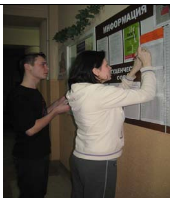
2.Итоги рейда комиссии еженедельно отражаются на экране санитарного состояния (общ. № 2)