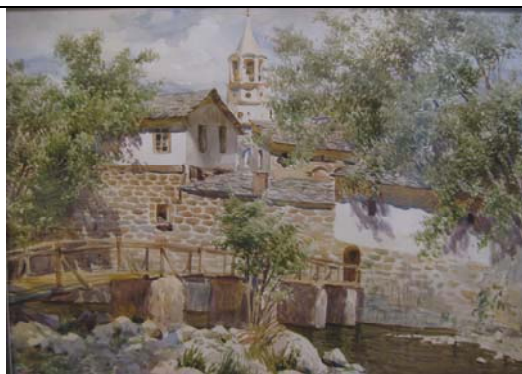
Дряновский монастырь. (Болгария. 1989)