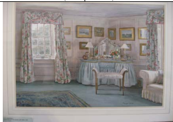
Бирюзовая спальня. (Англия. 1994)