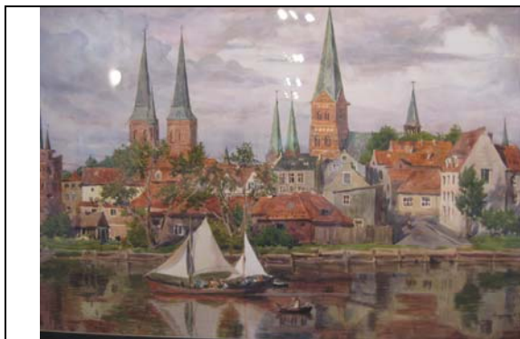
Городок Любек. (Германия. 1991)