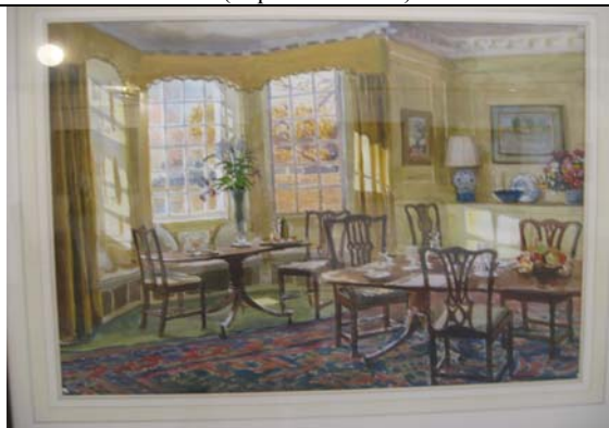
Столовая. (Англия. 1994)