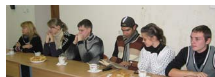
Заседание клуба «Брестская крепость» проходило в общ. № 2, ауд.8