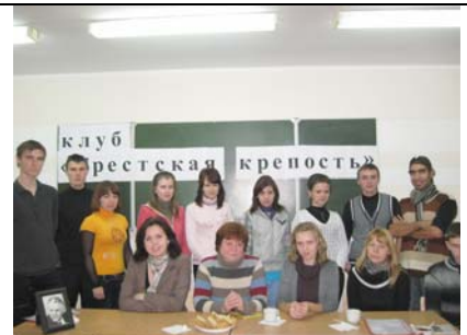
Фото на память.