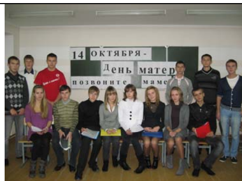
Студенты общежития № 2 - участники лирической странички устного журнала «Восславим женщину-Мать!»