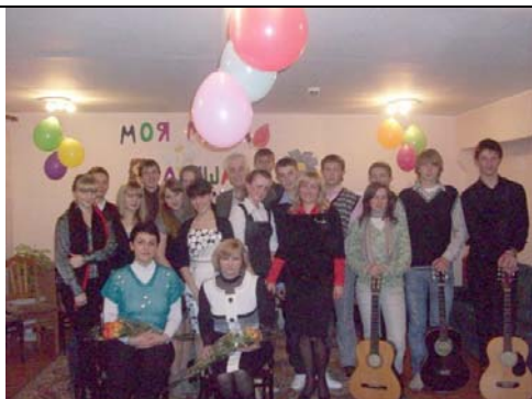
Участники и зрители вечера бардовской песни, посвященного дню Матери, в общежитии № 1. (АС-25-4)

Было утро в тихом доме, Я писала на ладони Имя мамино. Не в тетрадке, на листке, Не на стенке каменной. Я писала на руке Имя мамино. Было утром тихо в доме, Стало шумно среди дня. «Что ты спрятала в ладони?» - Стали спрашивать меня. Я ладонь разжала: Счастье я держала. (Агния Барто).