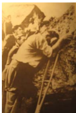
«Проклятие войне».