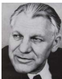
Сергей Сергеевич Смирнов

Вот что пишет об этой фотографии в своей книге «Брестская крепость» Сергей Сергеевич Смирнов: