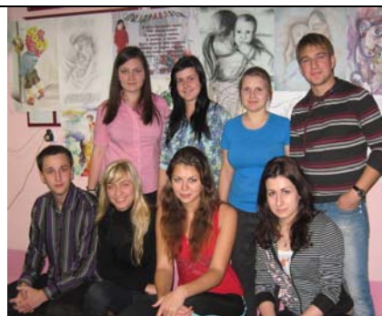
На фото: победители конкурса - авторы лучших плакатов.

Все участники конкурса будут поощрены деканатом факультета.