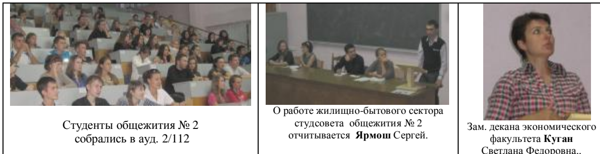
Студенты общежития № 2 собрались в ауд. 2/112