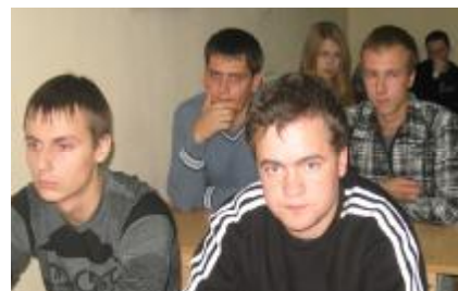
Встреча студентов депутатом проводилась в общежитии № 2 - ауд.8