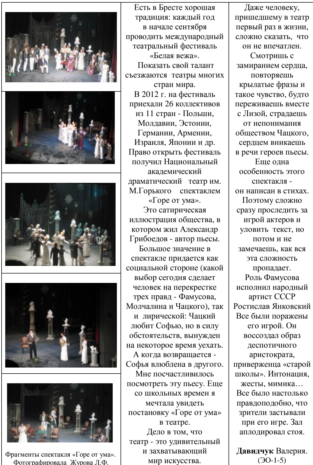
Фрагменты спектакля «Горе от ума».