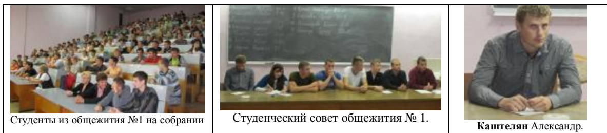
Студенты из общежития №1 на собрании

На собраниях, проведенных в сентябре 2012 г, актив отчитался о проведенной в прошлом учебном году работе. Выбраны студенческие советы на 2012-2013 учебный год.