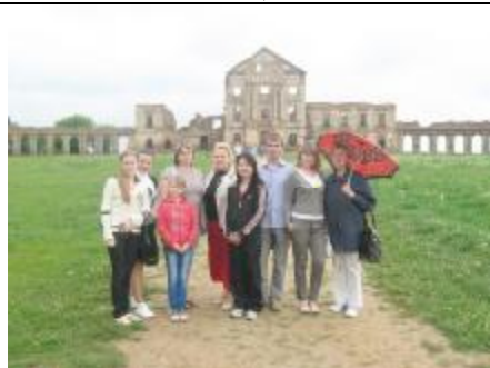
Ружаны. Дворец Сапегов.