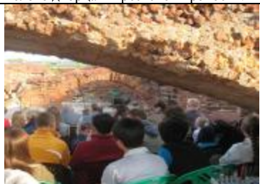
Зрители разместились в одном из залов разрушенного Белого дворца.