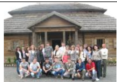
Музей-усадьба Тадеуша Костюшко в Коссово - аутентичный сельский дом, в котором родился видный деятель белорусского народного движения.