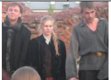
Слева-направо: герои пьесы А.Арбузова «Мой бедный Марат» - Леонидик, Лика, Марат. Роли исполнили выпускники Брестского музыкального колледжа им.Г.Ширмы.