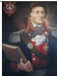
Тадеуш Костюшко (1746-1817) национальный герой Польши, США, почетный гражданин Франции.