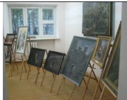
Выставка разместилась в ауд.8 общежития № 2.