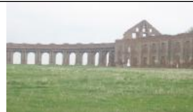
Ружаны. Руины дворцово-паркового комплекса, одного из крупнейших памятников дворцовой архитектуры Беларуси 16-18 вв., принадлежал Сапегам.