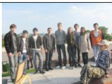
Студенты общежития № 2 на руинах Белого дворца в Брестской крепости.