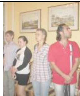
На экскурсии в одном из залов Пружанского палацка.