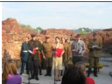
Участники композиции «Была война».