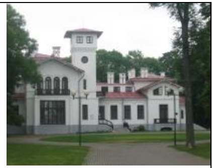
Усадебно-парковый ансамбль середины 19-го века. Пружанскі палацк.