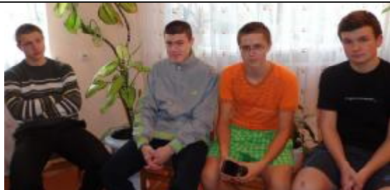
Беседа проводилась в комнате отдыха общежития № 1