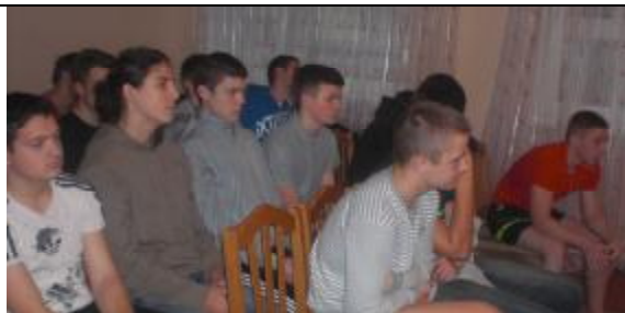
Студенты собрались в комнате отдыха общежития № 1