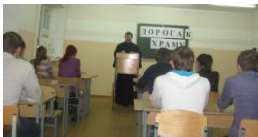
Беседа проводилась в общежитии № 2, (аудитория 8).