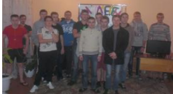
Участники кинолектория «Будущее - без табака».

К Всемирному дню отказа от курения в общежитии № 1 был проведен кинолекторий «Будущее - без табака».