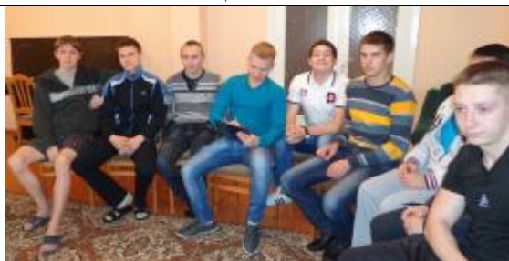
Студенты активно выполняли задания психолога.