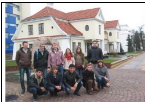
Студенты общежития № 2Б около музея «Спасенные художественные ценности».