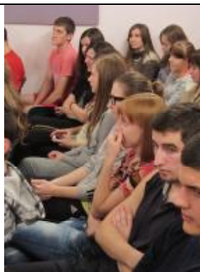
Студенты факультета ВиГ