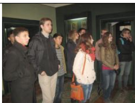
Студенты из общежития № 2Б на экскурсии в музее.