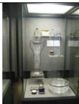
В коллекции музея - изделия фирмы Фаберже.