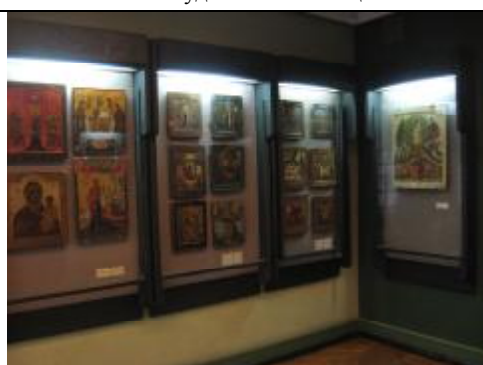
В музее - большая коллекция икон, которые пытались вывезти за границу контрабандисты.