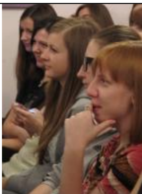
Болеем за своих!