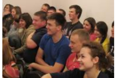
Вечер отдыха проходил в комнате отдыха общежития № 4.