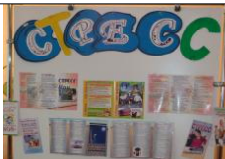
Наглядное пособие, которое было использовано во время беседы.