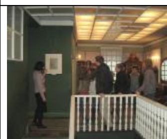
В одном из залов музея «Спасенные художественные ценности».