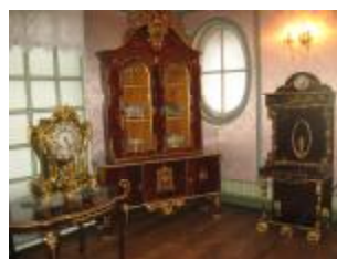
Изъятая на брестской таможне мебель 18-19 в., при попытке ее незаконного вывоза за границу.