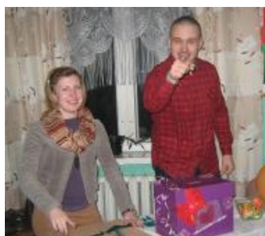
А ты отправил свою валентинку?