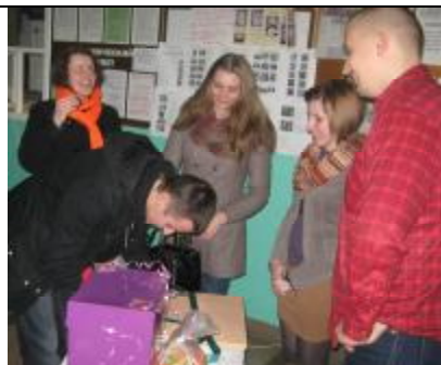
В очередь, товарищи влюбленные!