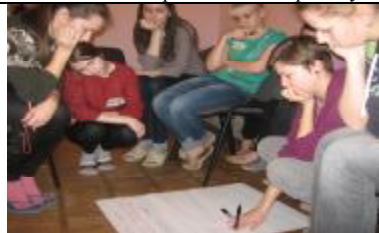
Студентки перечисляют трудности, с которыми можно столкнуться за границей.

19 февраля 2014 г. общежитие № 3 посетили две замечательные девушки - волонтеры из Брестского государственного университета им. А.С.Пушкина. Они провели с нами тренинг на тему: «Торговля людьми».