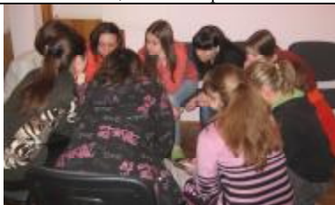
Девушки рассуждают о том, как обезопасить себя, выезжая за границу.