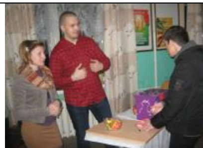
Главное - чтоб все от души и с любовью.