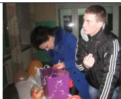
А вы мою валентинку читать не будете?