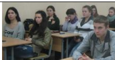
Студенты в ауд.8 общежития № 2