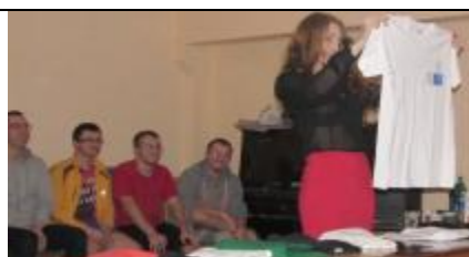
Конкурс «Как выбрать правильную майку?»