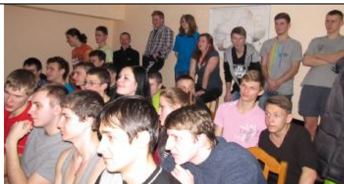
В комнате общежития № 1 отдыха свободных мест не было.