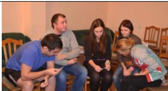
Диспут: «Обсуждение ситуации выбора».