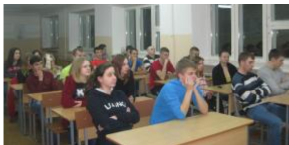
Беседы «Дорога к храму» проводятся в ауд.8 общежития № 2 два раза в месяц.