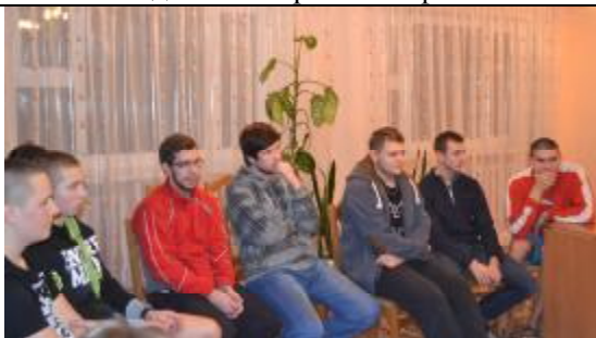
Студенты в момент раздумья об услышанном.