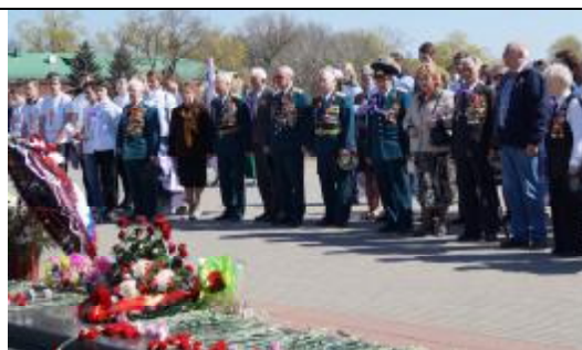
Возложение цветов у Вечного Огня.