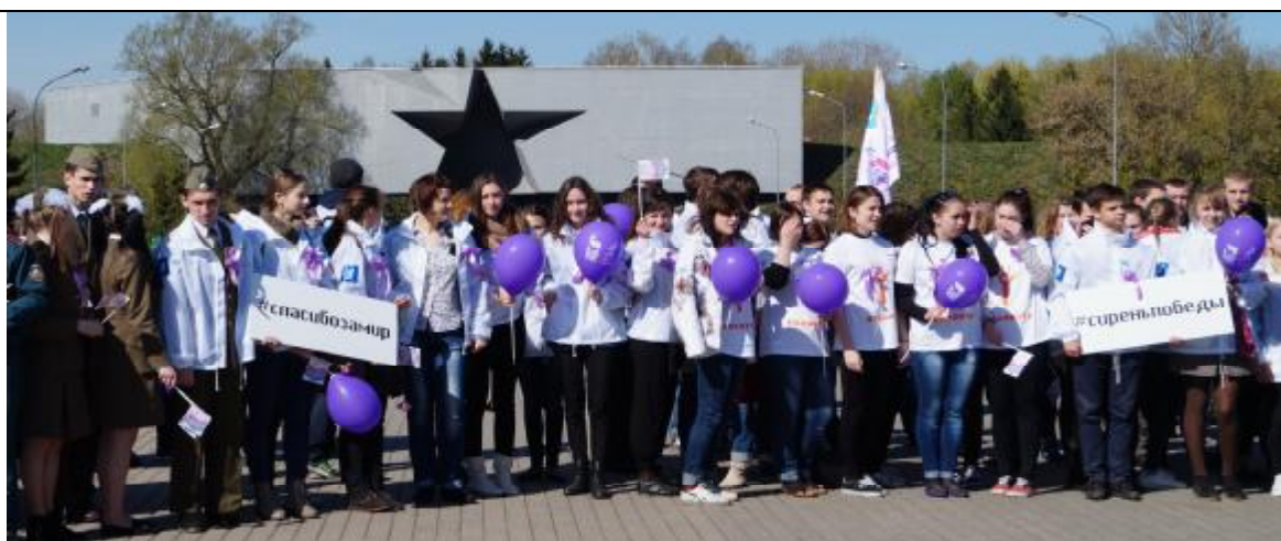
Участники акции у главного входа в мемориальный комплекс «Брестская крепость-герой»