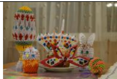
Оригами на пасхальную тематику выполнила Лекунович Наталья (ПЭ-12-2)