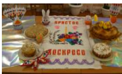
Праздничное украшение стола.