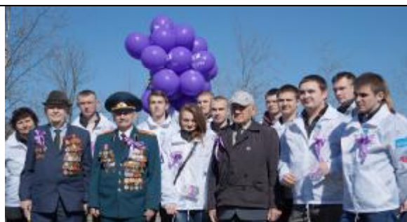
Студенты с ветеранами Великой Отечественной войны.