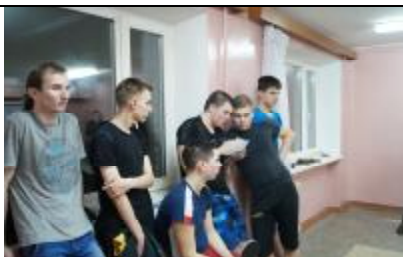
Зрители и участники соревнования.