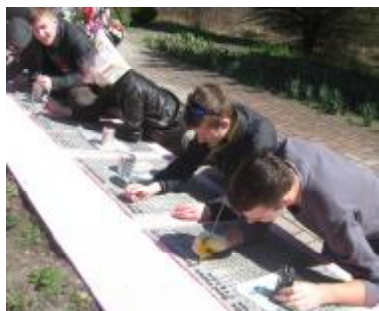
Это надо не мертвым, это надо - живым!

Ужасная трагедия произошла в деревне Борисовка в годы Великой Отечественной войны. Утром 23 сентября 1942 года, в ходе карательной операции, фашисты расстреляли 206 ее жителей, а 225 дворов сожгли.