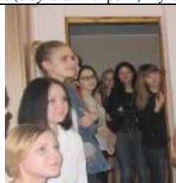
Конкурс вызвал у студентов огромный интерес.