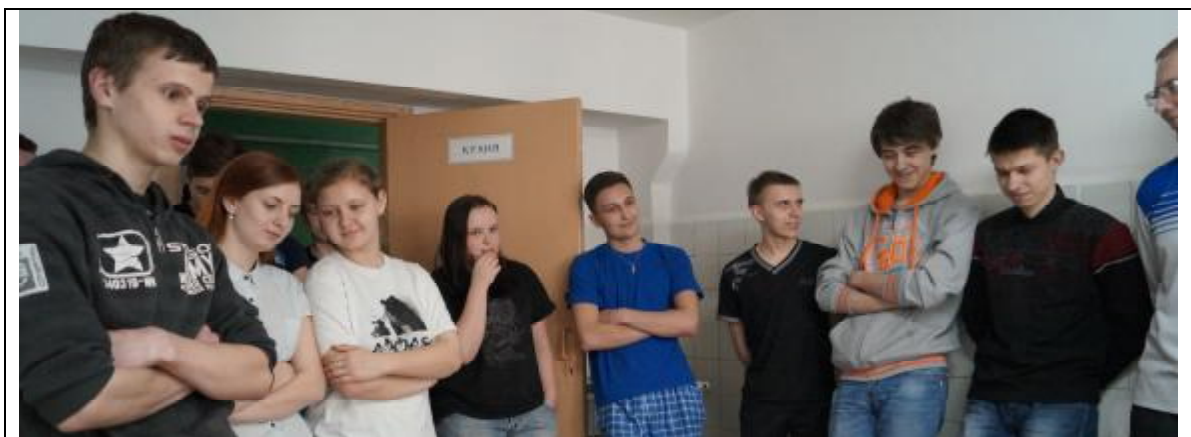
В кухне общежития № 1 собрались желающие принять участие в приготовлении и дегустации драников.

Белорусская кухня, зародившаяся в давние языческие времена, имеет богатую историю, многовековые традиции и является неотъемлемым компонентом национальной культуры.