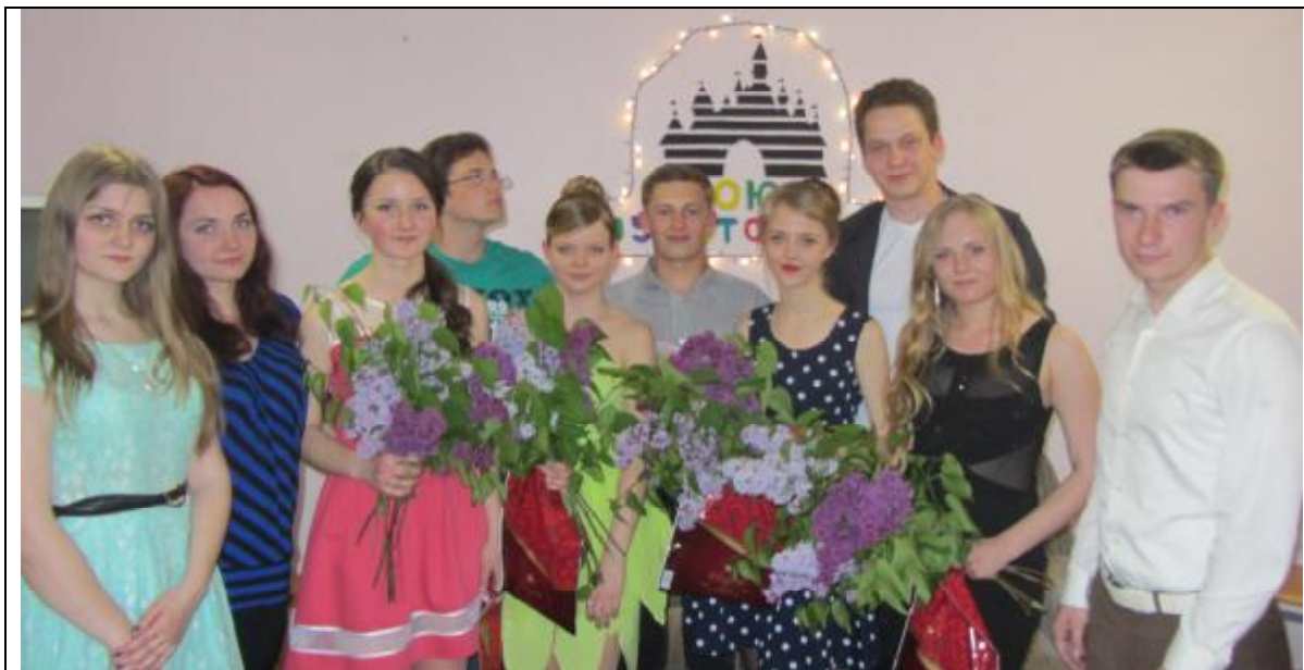
В центре (с букетами сирени) - участницы конкурса «Красота спасет мир»