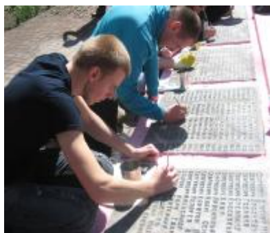
На плитах - имена погибших сельчан