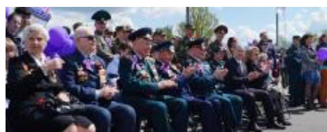
Ветераны Великой Отечественной войны.

9 Мая - значимая дата для каждого из нас. Ежегодно мы не забываем и ждем этот праздник - День Победы.