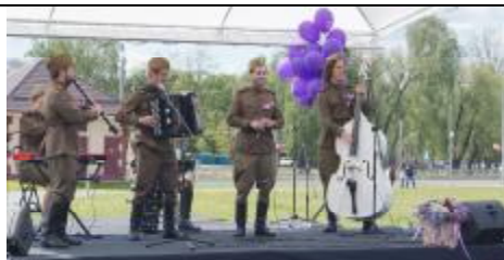
Выступает группа «MUZZART» (г.Брест)