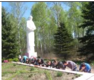
Вот уже более десяти лет студенты БрГТУ приезжают в Борисовку.

30 апреля 2015 г. студенты из общежитий № 2 и № 3 благоустраивали мемориал «Скорбящая Мать», который находится недалеко от Дивина - в деревне Борисовка, Кобринского района, Брестской области.