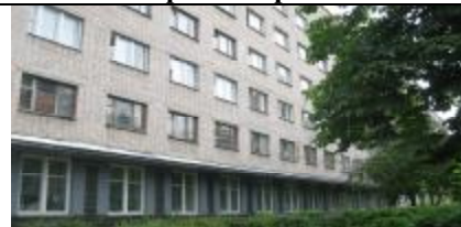
Общежитие № 2

За время моего проживания в общежитии № 2 у меня были только положительные эмоции.