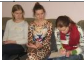
Тренинг проводился в комнате отдыха общежития № 3