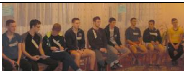
Участники тренинга «Безопасная граница» - студенты МСФ и ФЭИС в комнате отдыха общежития № 1