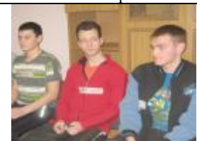
Тренинг в общежитии № 3