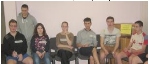
Участники тренинга в общежитии № 3 - студенты СФ