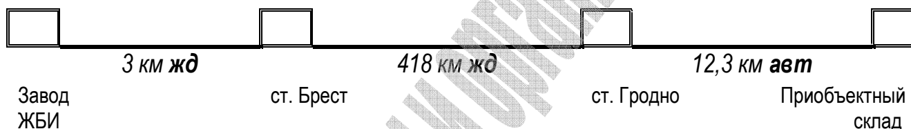
Рисунок 8.1. Схема перевозки груза

Требуется составить калькуляцию транспортных расходов по доставке ребристых плит покрытия размером 2,98x5,97 м на строительную площадку в г. Гродно с завода железобетонных изделий в г. Бресте. Вес одной плиты – 2,68 т. Доставка плит с завода-изготовителя до железнодорожной станции отправления Брест осуществляется железнодорожным транспортом по путям не общего пользования; далее следует перевозка от станции отправления Брест до станции назначения Гродно по железной дороге; затем – разгрузка из вагонов и погрузка в автомобильный транспорт и доставка до приобъектного склада в г. Гродно на расстояние 12,3 км полуприцепами-плитовозами. (см. рисунок 8.1). При составлении примера исходные данные были приняты условно, без учета оптимальности транспортной схемы.