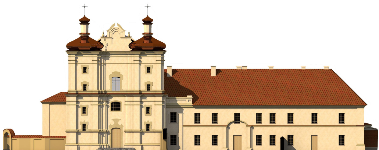
Рис. 2. Главный фасад

В камне первым был возведен в 1750 г. костел монастыря бернардинок [1, С. 115]. Каменный однонефный костел перекрыт цилиндрическим сводом, распор которого сдерживают устои [1, С. 115]. Каменный однонефный костел перекрыт цилиндрическим сводом,